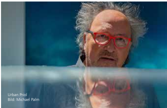
Urban Priol

Man kann nicht zwei Mal in den gleichen Fluss steigen, sagt Heraklit, alles Sein ist Werden. Man denkt an den Berliner Großflughafen, und merkt: der alte Grieche hatte recht. „Alles Sein ist Werden“ – zu diesem Schluss kommt Urban Priol regelmäßig, wenn er kurz vor der Deadline an seinem Presstext sitzt. Einem Fluss im ständigen Wandel gleich ist auch sein neues Programm. Mit Argusaugen verfolgt der Kabarettist den steten Strom des politischen Geschehens, auch wenn besonders die großkoalitionäre deutsche Politik der letzten Jahre eher an einen Stausee erinnert als an ein fließendes Gewässer. Priol ist immer am Puls der Zeit, spontan und agesaktuell spottet er oft schneller als sein Schatten denken kann.