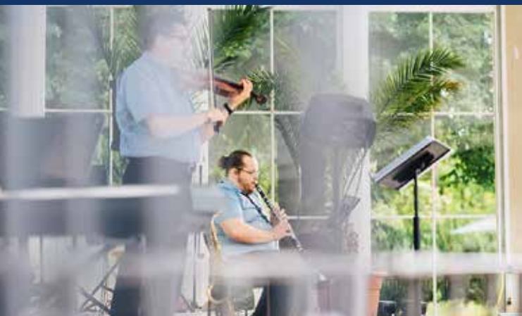
Kurensemble Bad Mergentheim

Nachmittagskonzerte täglich 15:30 Uhr und Abendkonzerte täglich 19:30 Uhr (außer Dienstag und Donnerstag), Eintritt frei mit Kur- und Gästekarte / Jahres-Einwohnerkarte