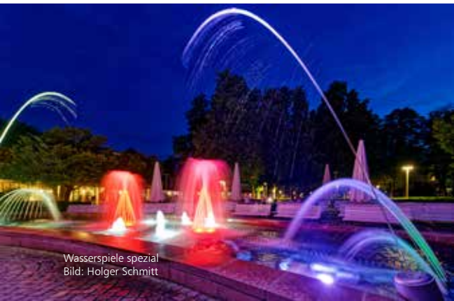
Wasserspiele spezial

In der Sommersaison gibt es nun an zwei Donnerstagen im Monat ganz besondere Wasserspiele: eine knapp einstündige Show in zwei Varianten, zusammengestellt aus all den täglich gespielten Liedern.